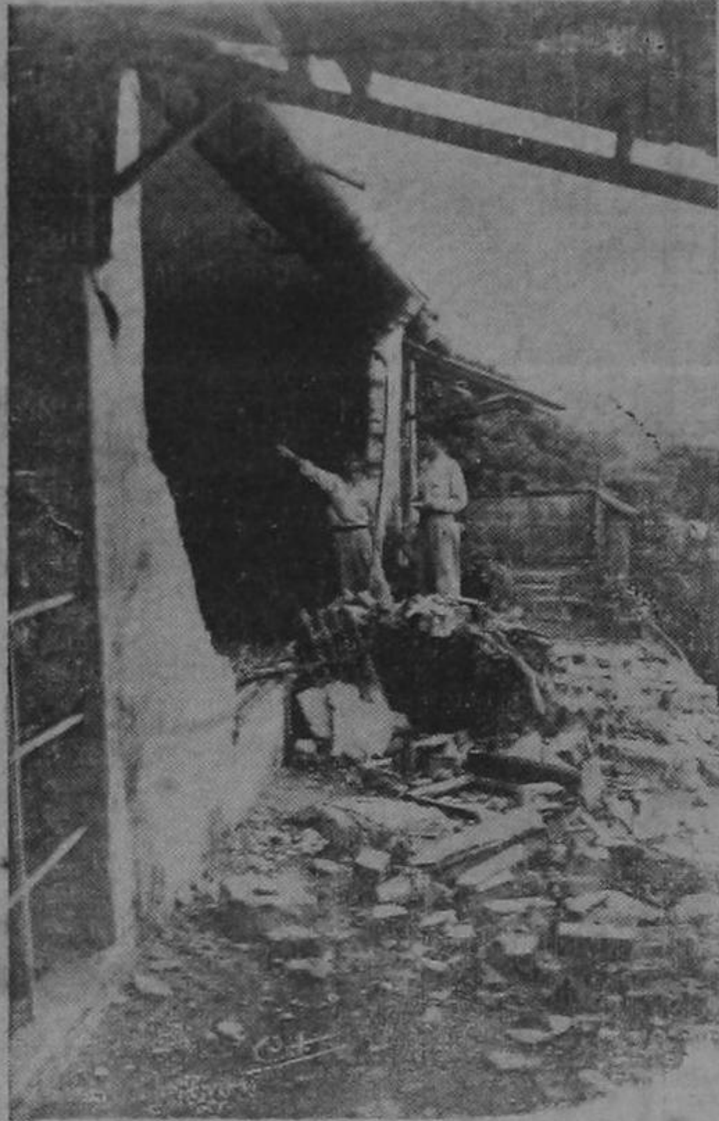
Un vecino muestra a un redactor del diario LA REPUBLICA las rajaduras de las paredes de una de las viviendas que amenazan desplomarse.