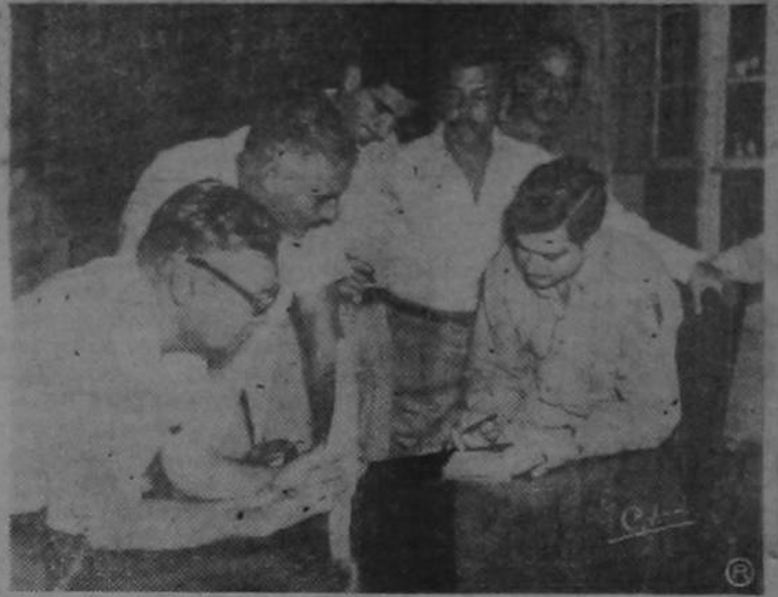
El señor Ministro de Seguridad Cor. Manuel Ventura con las autoridades de Limón deliberan sobre las medidas inmediatas que deben adoptarse para la solución provisional del problema creado a la población de Limón, en tanto el Gobierno adopta los acuerdos pertinentes.

A continuación reproducimos gráficas que presentan el desolador aspecto de diversas construcciones de nuestra capital como consecuencia del terrible movimiento sísmico.