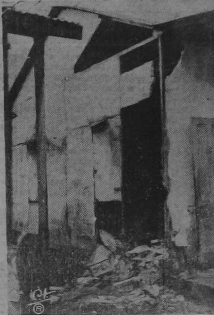
aspecto de una de las viviendas que sufrieron daños; como esta son muchas las casas humildes que han quedado destruidas y para cuyos habitantes constituye un angustioso problema