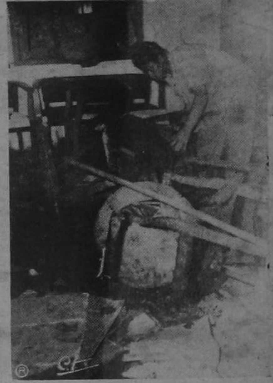
un aspecto del interior de la Farmacia Británica donde el temblor produjo incendio que destruyó completamente las existencias de mercancías además de los daños materiales al edificio.